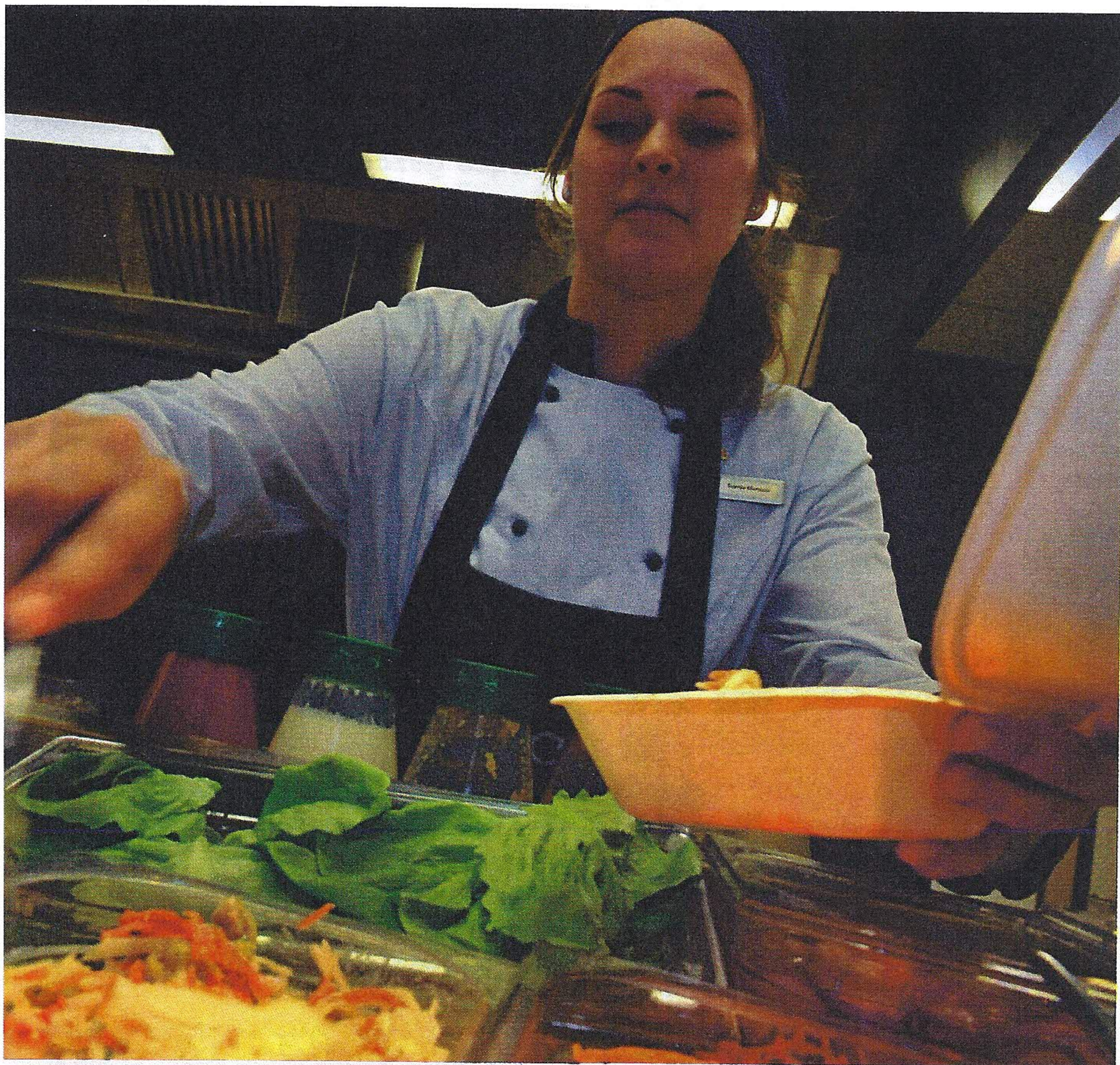
■ De gerechten worden in het nieuwe restaurant op disposables geserveerd.

bruik en behoorlijk gedateerd', weet ook Siebrith Hoekstein, senior beleidsadviseur bij de afdeling Facilities van de internationale hogeschool en tevens projectleider bij huisvestingsprojecten. De ideeën met de kantine waren al snel duidelijk. 'Het moest niet alleen maar een eetlocatie worden, maar meer een grote huiskamer, waar je het gevoel krijgt van bij je moeder aan de keukentafel.' Die tafel moest dan wel in een hele grote keuken staan. Alleen al in Leeuwarden lopen ongeveer 7500 studenten en 750 personeelsleden rond. Dat is